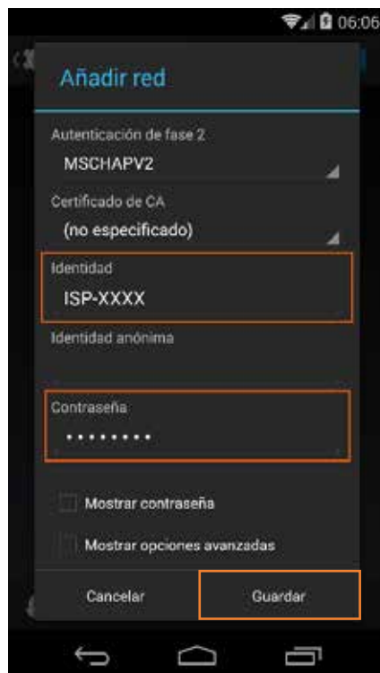
5 Insertamos usuario y contraseña y pulsamos Guardar

En caso de problemas o dudas técnicas sobre la red wifi de benicàssim, contactar con: soportewifi@sofistic.net