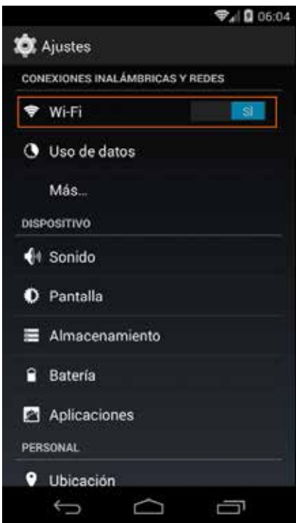
1 Activamos el wifi en el dispositivo Android.