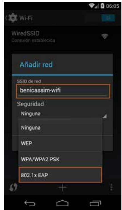
3 Insertamos el nombre de la red: benicassim-wifi Seleccionamos como seguridad 802.1x EAP